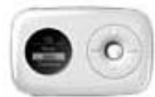
Disponible seulement en blanc

La commande en ligne... c'est vite... c'est pratique !